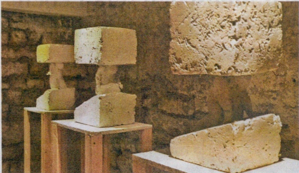
Der Bildhauer Michael Scholl aus Limbach hat den Kreuzweg als Spiegel des menschlichen Lebens mit all seinen Lichtblicken und Schattenseiten, mit Freude und Leid, Hoffnung und Verzweiflung geschaffen. Hier: Jesus fällt unter dem Kreuz.

Die Figuren sind angedeutet, sie haben keine Gesichter, Hände, Füße und sprechen durch ihre Haltung. Das Kreuz ist durch vertikale oder horizontale Balken angedeutet, manchmal fehlt es ganz. Die Darstellungen schildern Leid, Zerrissenheit, Unsicherheit – auch Gemeinschaft, Nähe, Zuversicht.